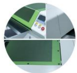
הזנה קדמית ואחורית