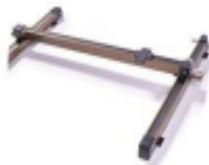
מודל דיוק גבוהה